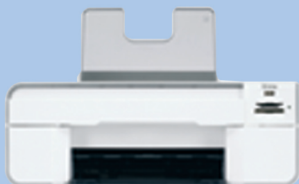
Imprimante photo multifonction Dell 944