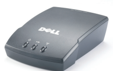
Adaptateur réseau sans fil Dell 3300 en option

Performances exceptionnelles. Simple comme