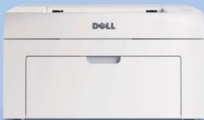
Dell Laserdrucker 1110