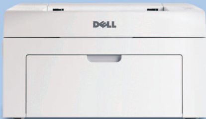
Imprimante laser Dell 1110

Produisez des documents monochromes de qualité professionnelle avec l'imprimante laser Dell 1110.