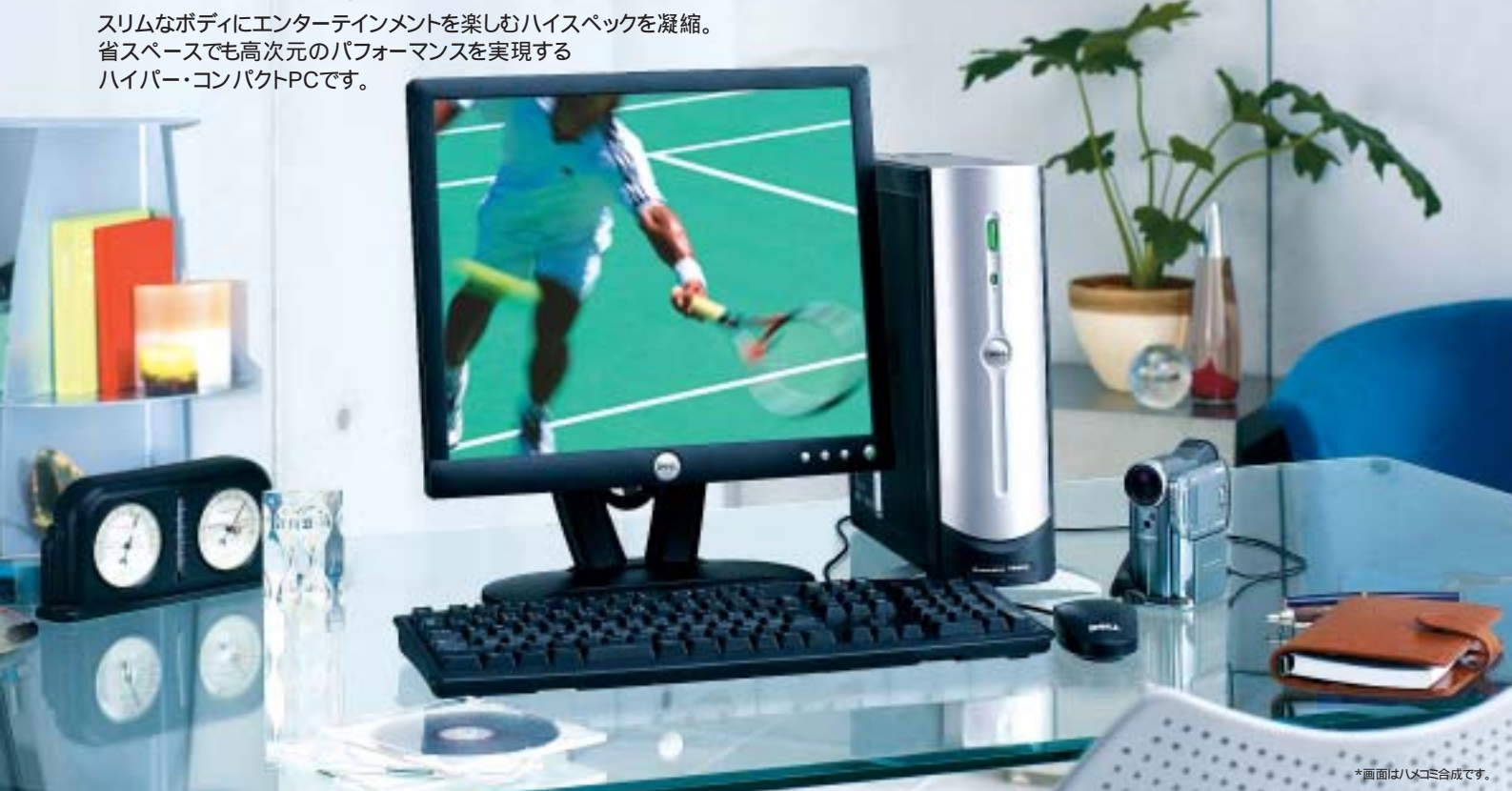
*画面はハズコム合成です。

デルがおすすめする Microsoft® Windows® XP Professional