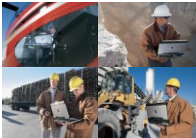
優れた耐久性を誇るデル独自の ATG 仕様で ビジネスノートPCの活用領域を革新