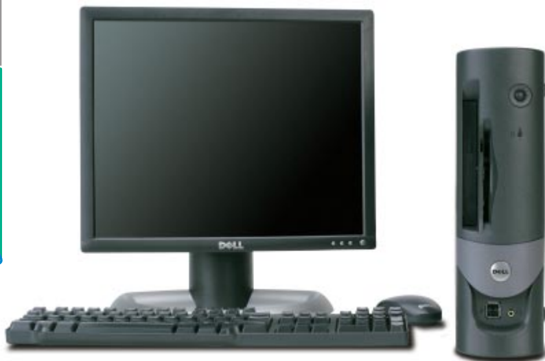
スモールフォームファクタモデル モニタは17インチ (別売) です。