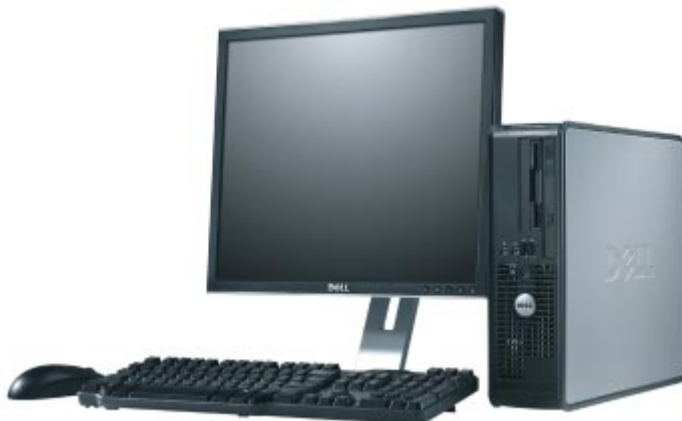
スモールフォームファクタモデル モニタは17インチ (別売) です。