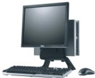
一体型ソリューション (USFF)