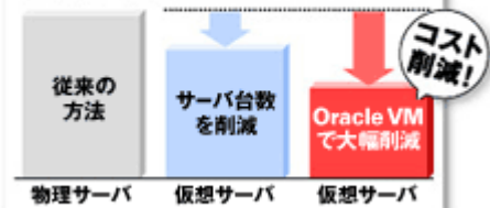
開発環境の構築コスト