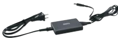
<45W専用小型ACアダプター>