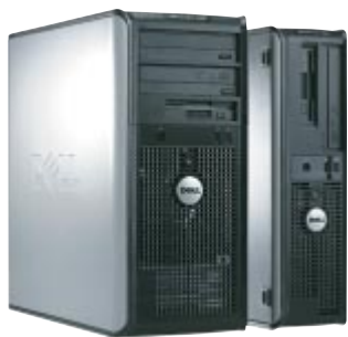
ミニタワー デスクトップ (2筐体からご選択いただけます。)

ビジネスの必須機能にフォーカスをあて初期導入コストを最小化 長期にわたる安定運用を通じて、管理コストの削減にも貢献