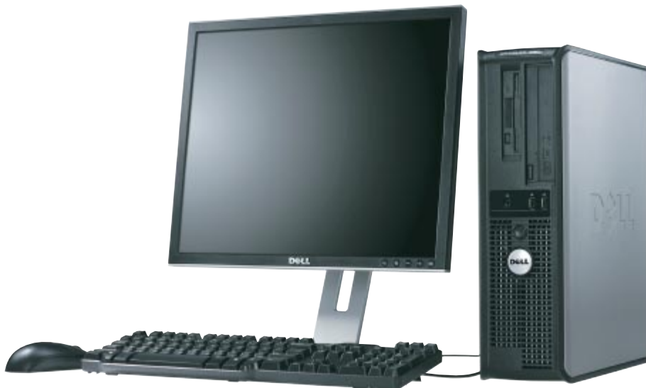
デスクトップモデル モニタは17インチ（別売）です。