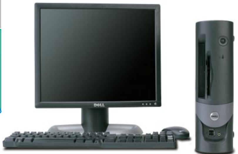
スモールフォームファクタモデル モニタは17インチ (別売) です。