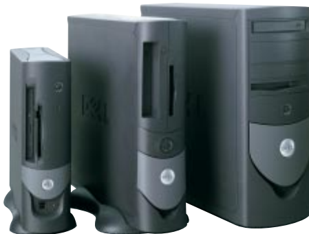
スモールフォームファクタ スモールデスクトップ スモールミニタワー (3筐体からご選択いただけます。)

OptiPlexの標準保守は3年間の「翌営業日出張修理 (オンサイト) サービス」。ご連絡をいただいた翌日に、エンジニアが直接訪問し修理を実施します。電話サポートは充実の24時間365日。また、OptiPlex全製品には一台一台、タグ番号と呼ばれる個体識別用のシールが添付されています。タグ番号を通して、障害履歴、お問い合わせ内容、使用パーツなどの情報をデータベースで管理。万一のトラブルの際にも、的確かつスピーディなサポートを提供します。