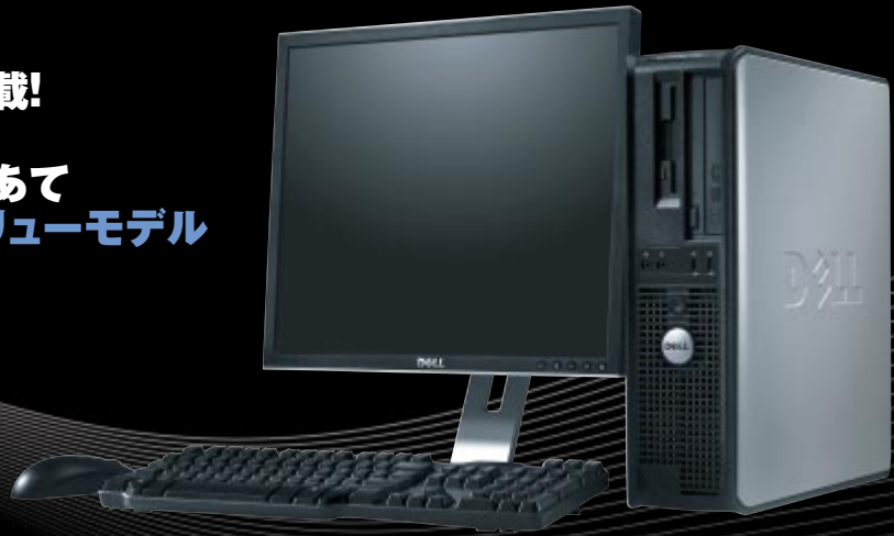
デスクトップモデル モニタは17インチ(別売)です。

ビジネスに必要な機能を搭載! 多様なニーズに対応 省電力や管理性にも焦点をあて TCOの削減に貢献するバリューモデル