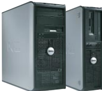
ミニタワー デスクトップ (2筐体からご選択いただけます。)