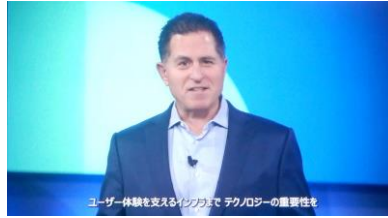
冒頭のビデオメッセージで登壇した CEOのマイケル・デル