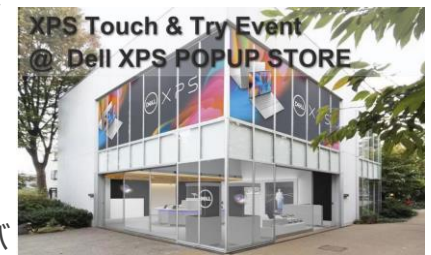
期間限定で、代官山IT-SITEに「 DELL XPS POPUP STORE 」をオープン

7月1日、製品紹介と展示エリアでのタッチ＆トライを通じて、フラッグシップモデルであるXPSシリーズ新製品をご紹介しました。「DELL XPS」のアンバサダーを務める、タレントのNMB48の渋谷凧咲さんに登壇いただき、実機の感想やアンバサダーとしての活動、ポップアップストアについて語ったトークセッションを実施しました。