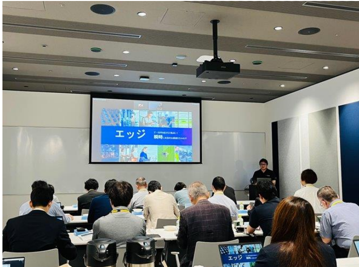
エッジコンピューティングの定義